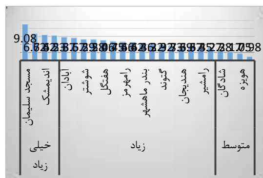
نمودار ۳. سطح‌بندی میزان مهاجرفرستی شهرستان‌های استان خوزستان (۱۳۹۵)

طبق اطلاعات مندرج در جدول ۳، بیشترین میزان مهاجرفرستی متعلق به شهرستان مسجد سلیمان (۹/۰۸) و کمترین میزان مهاجرفرستی متعلق به شهرستان باوی (۰/۹۸) می‌باشد. این شهرستان‌ها را بر اساس میزان مهاجرفرستی می‌توان در سه دسته مهاجرفرستی متوسط (۰ تا ۳)، مهاجرفرستی زیاد (۳ تا ۶) و مهاجرفرستی خیلی زیاد (۶ تا ۱۰) سطح‌بندی نمود. نمودار ۳، سطح‌بندی میزان مهاجرفرستی شهرستان‌های استان خوزستان در سال ۱۳۹۵ را نشان می‌دهد: