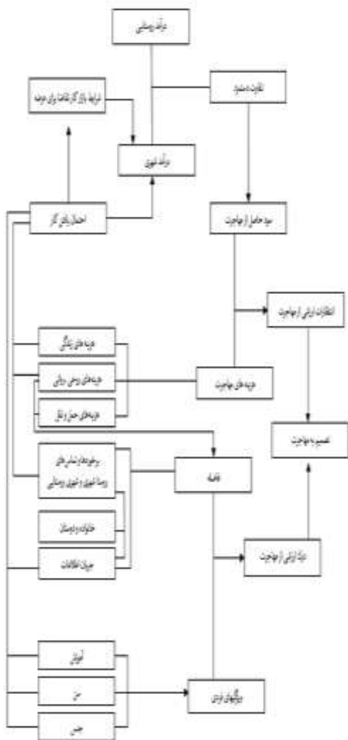
شکل ۲. عوامل مؤثر بر شکل‌گیری مهاجرت از دیدگاه شفر [۱۴].

شفر ۲ (۱۹۹۳) نیز، دلایل و عوامل مهاجرت را به صورت مدل زیر نشان داده است [۱۴].