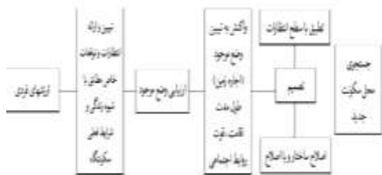
شکل ۱. عوامل مؤثر بر شکل‌گیری مهاجرت از دیدگاه پائول شاو [۱۳].

شفر ۲ (۱۹۹۳) نیز، دلایل و عوامل مهاجرت را به صورت مدل زیر نشان داده است [۱۴].