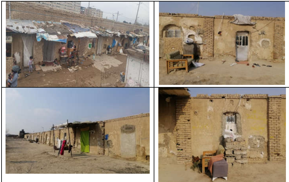
شکل ۳- سکونتگاه‌های غیررسمی در مجاورت زمین‌های اطراف کوره‌ها

مجبور بودند از همان خاک استفاده کنند یا از شهرهای دیگر خاک بیاورند که برایشان توجیه اقتصادی نداشت. از طرف دیگر همان حوالی دهه ۵۰، کارخانه‌های آجرسازی که مکانیزه آجر تولید می‌کردند، شروع به کار کردند و با توجه به اینکه این روش، بهینه نبود، حرفی در مقابل کارخانه‌ها نداشتند و از همان زمان، خیلی‌ها رو به افول بودند و دهه ۶۰ الی ۷۰ خیلی‌ها تعطیل شدند. شهرداری و محیط‌زیست هم شروع کردند به آنها تذکر دادن و سال ۶۸ یک‌سری را فضای سبز اعلام کردند و در نهایت ضربه آخر را سال ۷۱، قانون محیط‌زیستی که تصویب شد که صنایع آلاینده باید خارج از شعاع ۱۲۰ کیلومتری شهر باشند، وارد کرد و تقریباً کوره‌های فعالی در منطقه باقی نمانده بود و قبل از دهه ۷۰ همه کوره‌ها را جمع کردند. از آن به بعد هم یک تعداد خیلی کمی در کارهای مشابه مثل ساخت بتن کار می‌کردند، ولی غالب آنها دیگر توانایی کار کردن و بهره‌گیری اقتصادی از زمین را نداشتند؛ چون شهرداری و همین‌طور وزارت صنعت و معدن اجازه کار نمی‌داد و تا الان این زمین‌ها باقی مانده است».